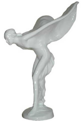
Rolls-Royce - Emily

Überzeugen Sie sich von der Einzigartigkeit und der künstlerischen Leistung, die hinter jedem unserer handgefertigten österreichischen Qualitätsprodukten steht mit einer Führung durch die Manufaktur im Schloss Augarten.