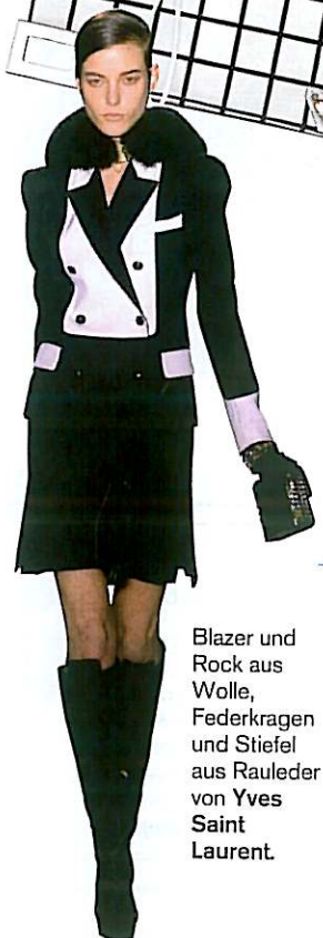
Blazer und Rock aus Wolle, Federkragen und Stiefel aus Rauleder von Yves Saint Laurent.