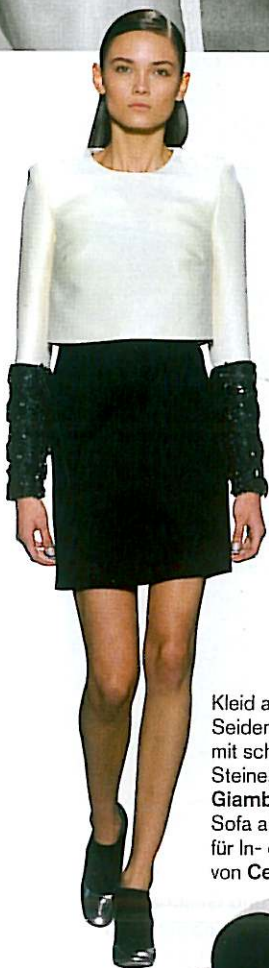
Kleid aus Woll-Seiden-Gemisch mit schwarzen Steinen besetzt von Giambattista Valli, Sofa aus Kunstleder, für In- oder Outdoor von Cerruti Baleri.

ist wirklich viel Spielraum. Weiße Blusen und schwarze Rollkragenpullover sind seit Jahren meine Lieblingsteile für den Herbst. Allerdings werde ich heuer rote Pumps dazu kombinieren, die ich unter schwarzen Hosenbeinen nur ganz dezent hervorblitzen lassen werde. Ebenfalls angesagt sind derzeit Choker, also eng anliegende große Halsketten. Kombiniert mit einem einfachen schwarzen Pullover sind sie ein absoluter Hingucker. Doch das schwarz-weiße Doppel sieht man nicht nur in der Mode, auch in der Einrichtung ist es ein Renner. Das Art déco fungiert hier als großes Stilvorbild. Ein österreichischer Klassiker ist das Kaffeeservice „Melone“ aus der Porzellanmanufaktur Augarten. Das Design von Josef Hoffmann besteht nun seit fast hundert Jahren durch seine Klarheit und Einfachheit. Lassen Sie sich von ihm inspirieren und zeigen Sie Kontrast.