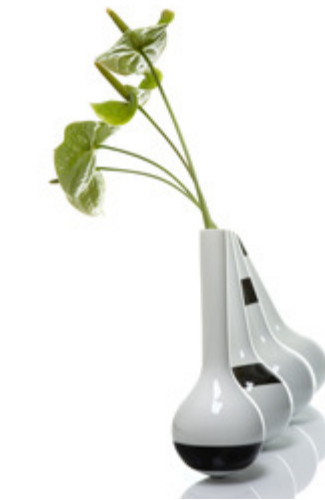
»Pinocchio«, Philipp Bruni für Augarten