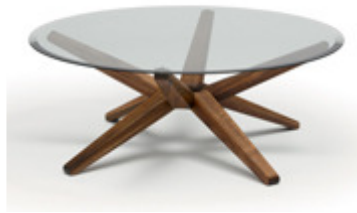
»Stern«, Team 7