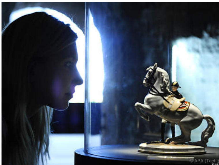
Museum ab Mittwoch geöffnet

Das Wiener Traditionsunternehmen Augarten-Porzellan hat nun ein eigenes Museum, das "Porzellanmuseum im Augarten".