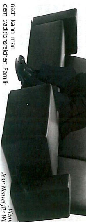
„Vienna“ von Jean Nouvel für Wittmann

Kaum zu glauben , aber wahr: Beim größten und wichtigsten Möbelsalon mischte sich lediglich ein einziges österreichisches Unternehmen in den bunten, international hochkarätig besetzten Designreigen: Wittmann. So erntendend dieses Faktum auch klingen mag, so euphorisch kann man dem traditionsreichen Familienunternehmen nur gratulieren.