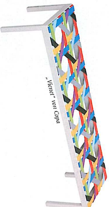
„Viener“ von Copal