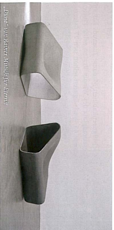
„Dune“ von Ramer Mutschler Eernit