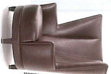
„Harlem“ von Wolfgang Joop für Neue Wiener Werkstätte