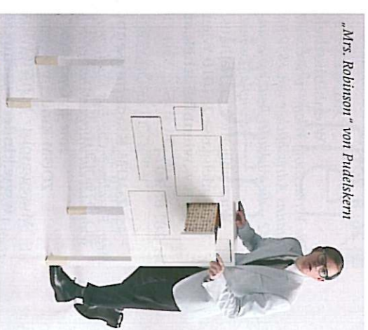
„Mrs. Robinson“ von Pridis Kerni

KREATIVES ÖSTERREICH Die Ausstellung „Design Vision Austria“ während des „Salone Internazionale del Mobile 2011“ ließ vergessen, dass zwischen Wien und dem Designmekka Mailand 800 Kilometer liegen. Österreich mischt mit in der internationalen Designszene. Und zwar ordentlich.