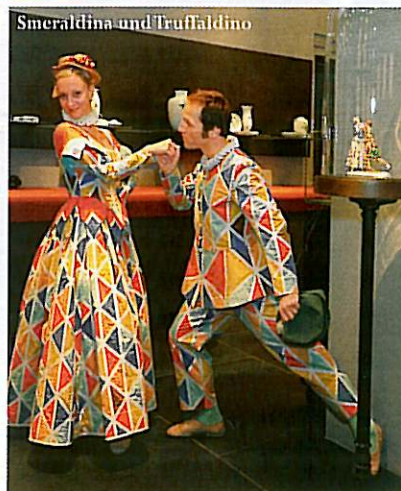
Smeraldina und Truffaldino