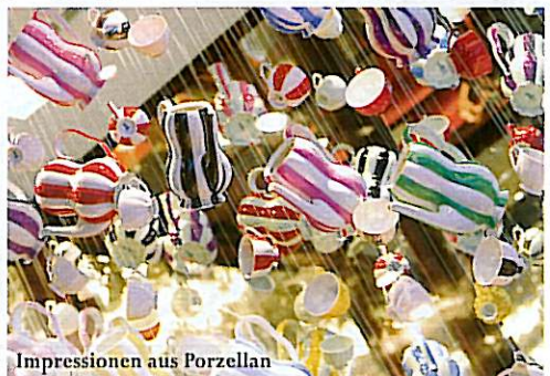
Impressionen aus Porzellan